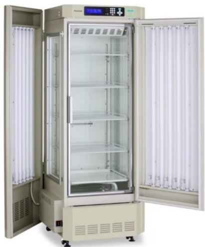
PHCbi / Panasonic växtodlingskåp